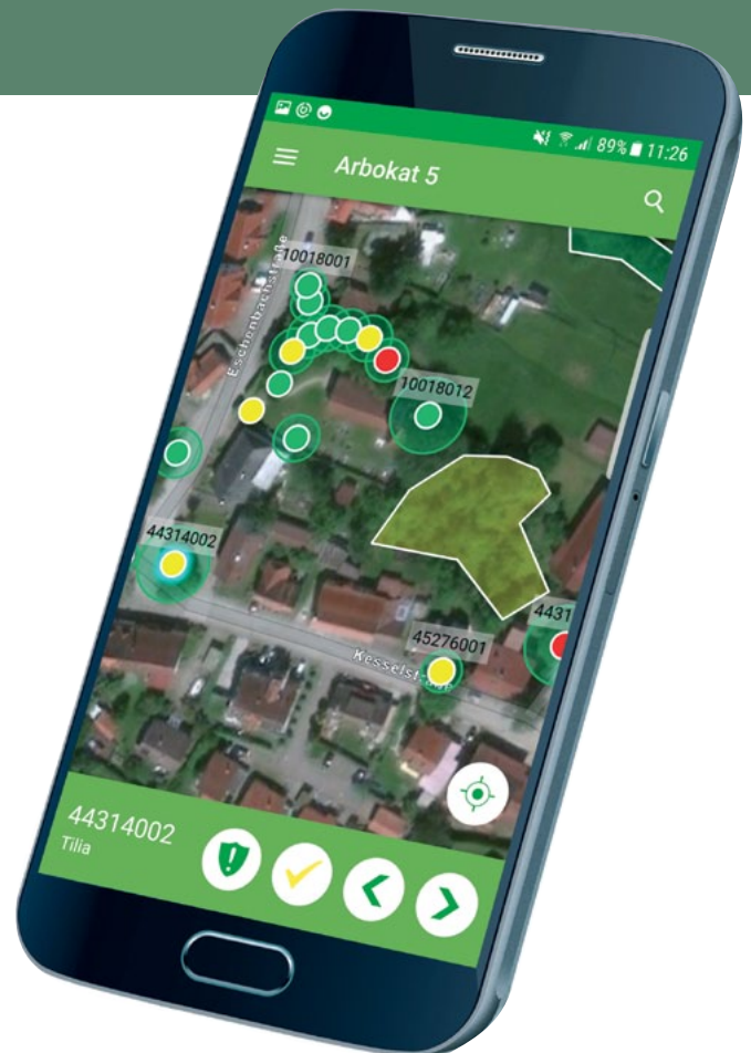
Arbokatk® App: Baumkontrolle schnell und unkompliziert

Als Kartengrundlage nutzt die Arbokat® App hochwertige Hintergrundkarten aus ArcGIS Online (Luftbilder und Straßendaten). Die Bereitstellung von Geodaten für den Außendienst ist nicht notwendig.